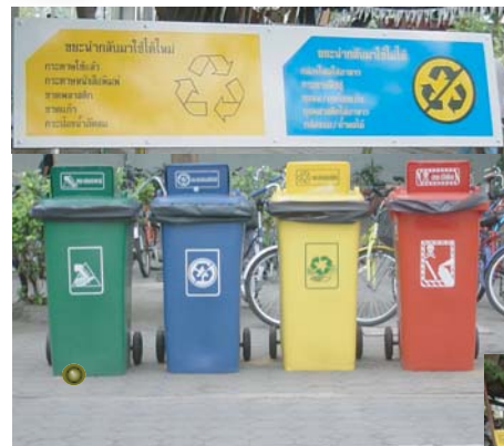
ถังขยะภายนอกอาคาร