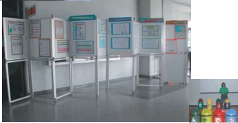
บรรยากาศภายในงานฝึกอบรมและนิทรรศการ

● จัดทำโรงแยกขยะและธนาคารขยะ ได้จัดทำโรงแยกขยะ และเริ่มจัดระบบธนาคารขยะชนิดนำกลับมาใช้ใหม่ได้มาก่อนให้เกิดประโยชน์