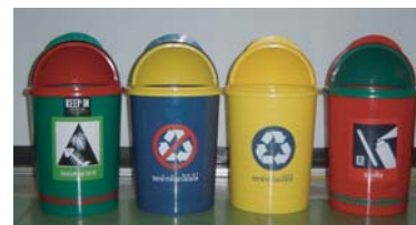
ถังขยะภายในอาคาร